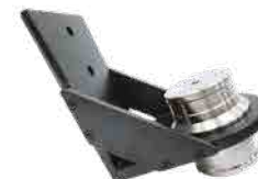
ユーロアダプター