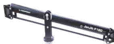
JAN JIB 本体