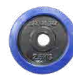
2.5kg ウェイト × 1