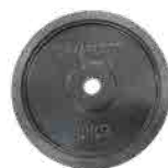
10kg ウェイト × 4