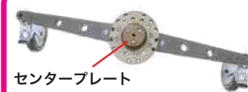
センタープレート