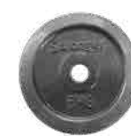
5kg ウェイト × 5