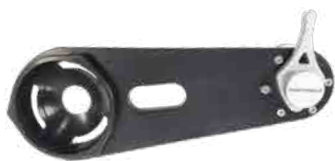
φ150 オフセットアーム