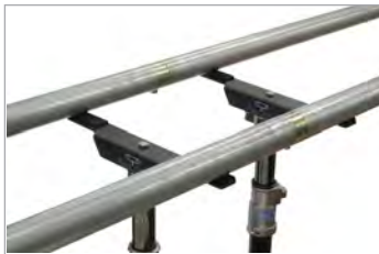
[ スタンド使用 ]