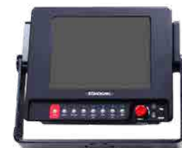
CINE Monitor HD