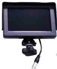
⑦ リターンモニター (フード/スタンド/ソフトケース付)