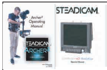
⑤ 取扱説明書 × 2 (本体用 / CINE Monitor HD 用)