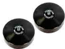
⑧ 1ポンド丸型ウェイト ×2