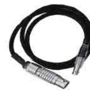
AMIRA/ALEXA mini ステディ電源ケーブル (LEMO 8pin-LEMO 3pin)