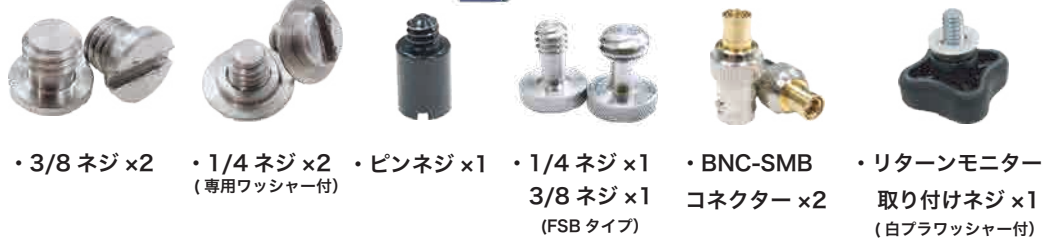
・3/8 ネジ ×2 ・1/4 ネジ ×2 (専用ワッシャー付) ・ピンネジ ×1 ・1/4 ネジ ×1 3/8 ネジ ×1 (FSB タイプ) ・BNC-SMB コネクター ×2 ・リターンモニター 取り付けネジ ×1 (白ブラワッシャー付)