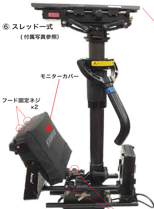
モニターカバー フード固定ネジ ×2