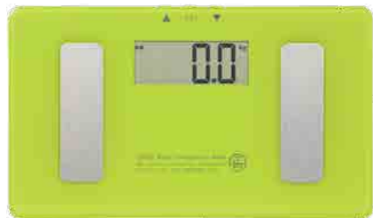
④ 体重計 (ソフトケース入り)