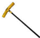
⑩ T型レンチ (1/4インチ)