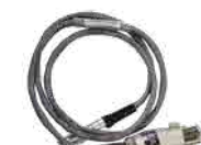
12V 4pin POWER ケーブル (I型)