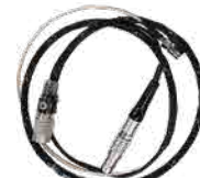
RETURN MONITOR ケーブル