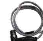
12V 4pin POWER ケーブル (L型)