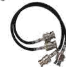
BNC 0.25m ケーブル