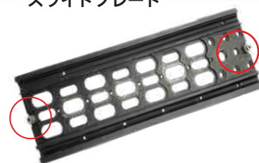
裏面 落下防止ビス ×2