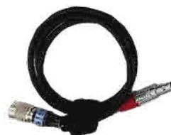
BOLT-TOMAHAWK ステディ電源ケーブル (ヒロセ 4pin-LEMO 2pin)