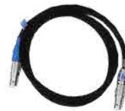
CARAT ステディ電源ケーブル (LEMO 2pin-LEMO 3pin)