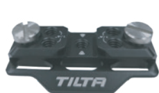
トッププレート (1/4 ネジ×2)