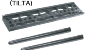
φ15 ロッド 20cm × 1 SET