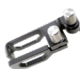
ケーブルクランプ (ネジ×2)