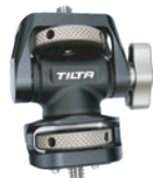
モニターマウント