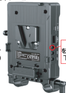
アダプタープレート (φ15 ロッドコンソール付)