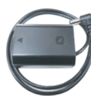
DC カプラー (NP-FZ100)