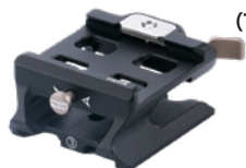
カメラプレート (1/4 六角ネジ×2)