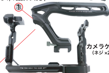
カメラケージ (ネジ×2付)