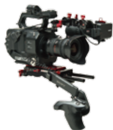
LANC 端子を持ったカメラ (FS7 等)