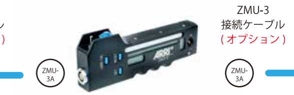
ZMU-3 接続ケーブル (オプション)