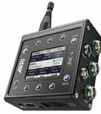
UMC-4 (3 モーター 可能)