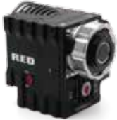
RED DSMC1 Epic-M • SCARLET • DRAGON SCARLET-W ※1