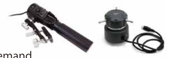
Canon zoom / focus demand