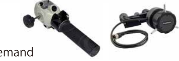
FUJINON zoom / focus demand