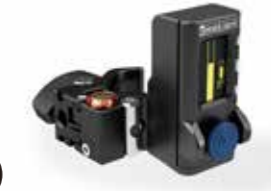
pan-bar zoom ※3