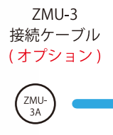
ZMU-3 接続ケーブル (オプション)