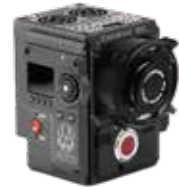
RED DSMC2 HELIUM • EPIC-W • RAVEN WEAPON DRAGON