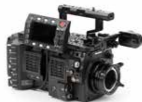
Panasonic Varicam35 • LT