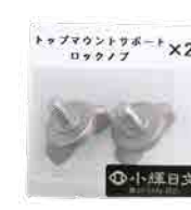
トップマウント サポートロックノブ×2