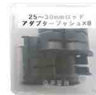
25-30mm ロッドアダプターブッシュ×8