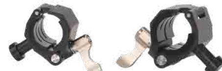
サイドマウントロッドクランプ×2