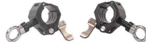
トップマウントロッドクランプ×2