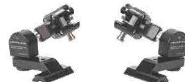
3軸ジンバルアダプター (L)(R)